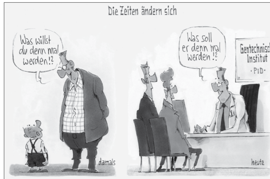
Cartoon: Gerhard Mester

Adressänderungen der Post kosten uns 2 Franken – bitte bei Umzug neue Adresse melden.