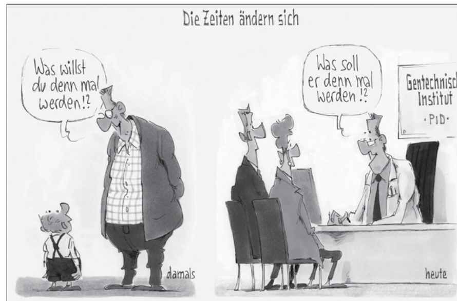
Cartoon: Gerhard Mester

Adressänderungen der Post kosten uns 2 Franken – bitte bei Umzug neue Adresse melden.